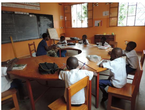
Une institutrice et ses élèves en 1 ère année