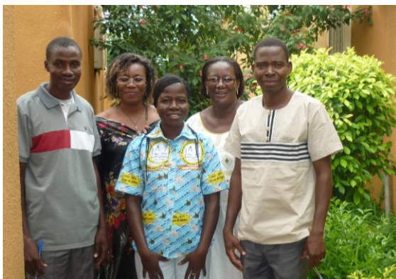
Equipe du Projet UN-ABPAM dédiée aux projets SHC

Ce projet, initié en 2009, avait déjà permis à 7 écoles de scolariser près de 200 enfants avec un handicap visuel grâce à la construction et l'équipement de classes, la formation des encadreurs pédagogiques, la sensibilisation et le dépistage et surtout à l'équipe dynamique de l'UN-ABPAM.