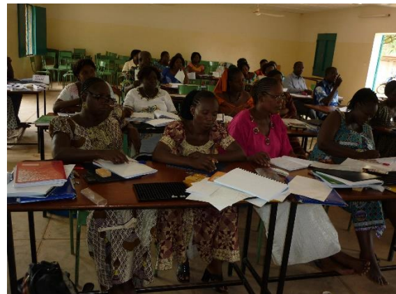
Séance de formation de professeurs de classes inclusives par les formateurs de l'ABPAM

Un des objectifs de SHC consiste à ce que les partenaires avec qui nous travaillons acquièrent l'expertise pour pouvoir scolariser les enfants avec un handicap sensoriel. L'ABPAM est un centre de référence dont l'expertise est reconnue par le ministère de l'éducation nationale et de l'alphabétisation dans le domaine du handicap visuel.